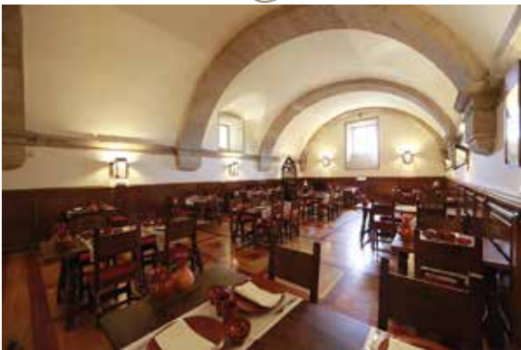
Restaurant San Francisco