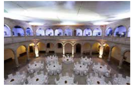
Patio de Cristal