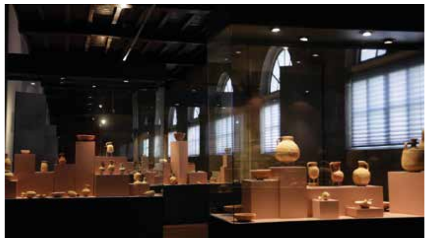
Ausstellungsstücke des Museums Tierra Santa