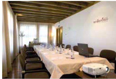
Saal Galería I und II