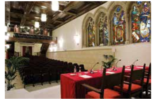
Tagungsraum „Auditorio Carlos V“

Kontakt: eventos@sanfranciscohm.com Tel.: 981 58 16 34