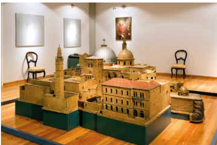
Entwurfsmodell der Grabeskirche