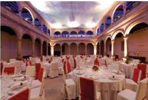
Bankett im Patio de Cristal