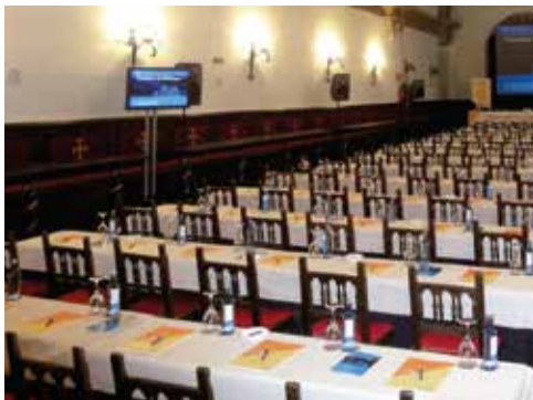
Sitzung im historischen Speisesaal „Comedor Monumental“