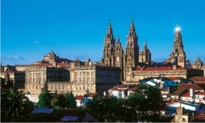
Blick auf Santiago de Compostela

Santiago de Compostela ist die Hauptstadt der autonomen Region Galiciens und Weltkulturerbe der UNESCO seit 1985. Außerdem ist sie das Ziel des Jakobsweges für Tausende von Pilgern aus aller Welt. Dieser tausendjährige Weg durchzieht den europäischen Kontinent seit dem Mittelalter und wurde daher als der Erste Europäische Kulturweg bezeichnet.