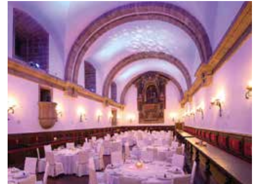
Speisesaal Comedor Monumental