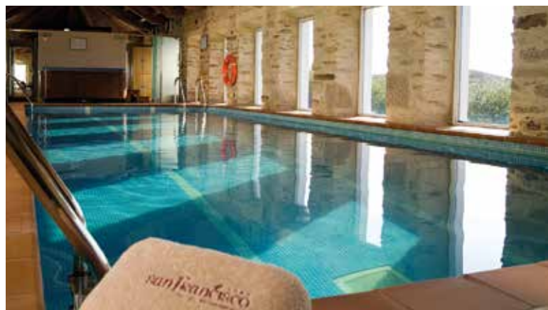
Klimatisiertes Schwimmbad mit Whirlpool