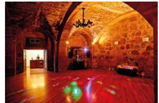
Tanz im Saal Bodega