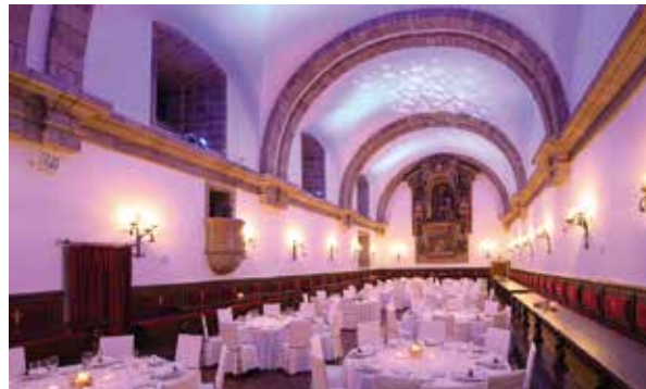
Speisesaal Comedor Monumental