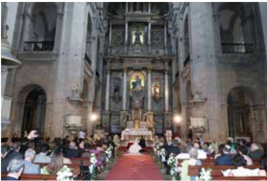
Innenansicht der Kirche San Francisco