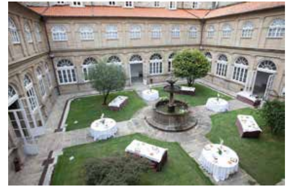
Aperitif im Claustro de La Fuente