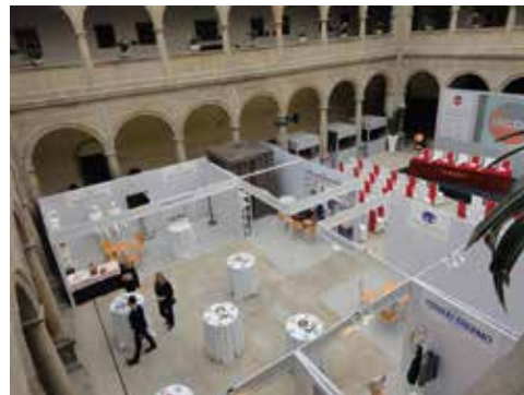
Veranstaltung im Patio de Cristal