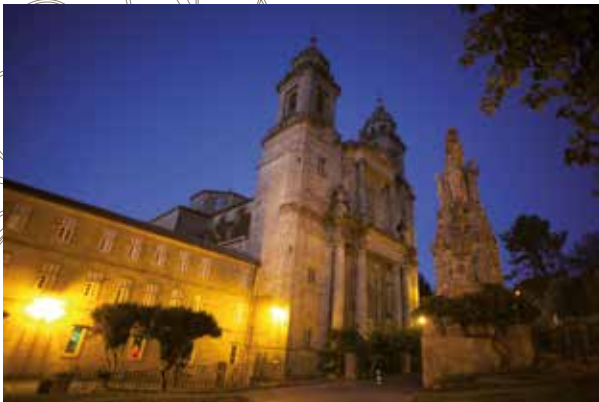
Fassade von San Francisco am Abend

Im Folgenden geben wir Ihnen einen kurzen Überblick über das Hotel. Wenn Sie Fragen haben, setzen Sie sich bitte mit der Hotelrezeption in Verbindung, indem Sie die 9 wählen.