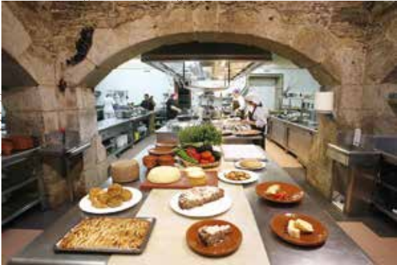
Küchen San Francisco 18. Jahrhunderts