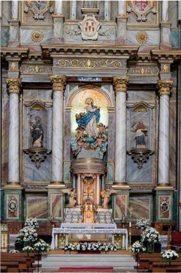
Kirche San Francisco