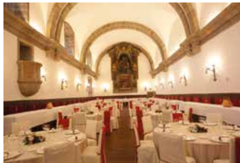
Bankett im historischen Speisesaal „Comedor Monumental“